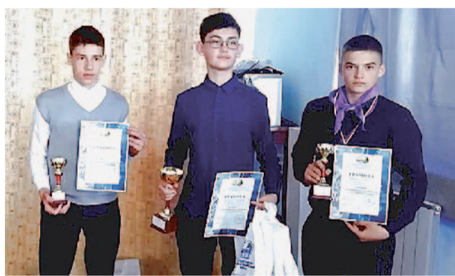
Подарки от Златмаша – приятный бонус

Конечно, говоря о трудовой доблести Златоуста, сложно переоценить вклад наших машиностроителей в общую Победу, поэтому и ребята из Центра юных техников решили сделать