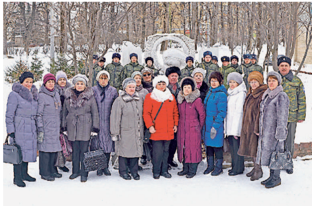
Наш сплоченный коллектив. Акция «Цветы на граните». Фото из архива.

Сердечно поздравляем ветеранов нашего предприятия и заводчан с наступающим Новым годом!